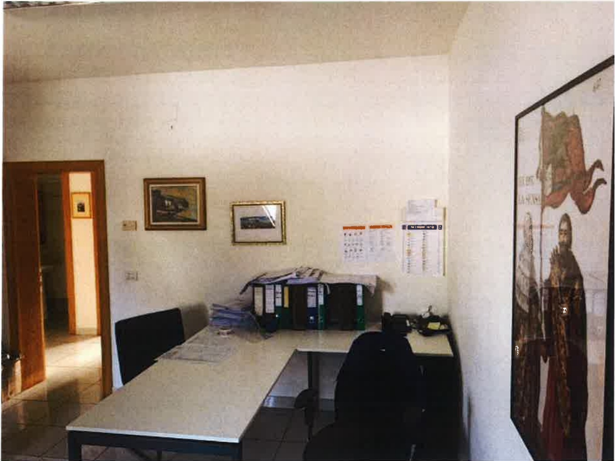
VISTA INTERNA LOTTO 2