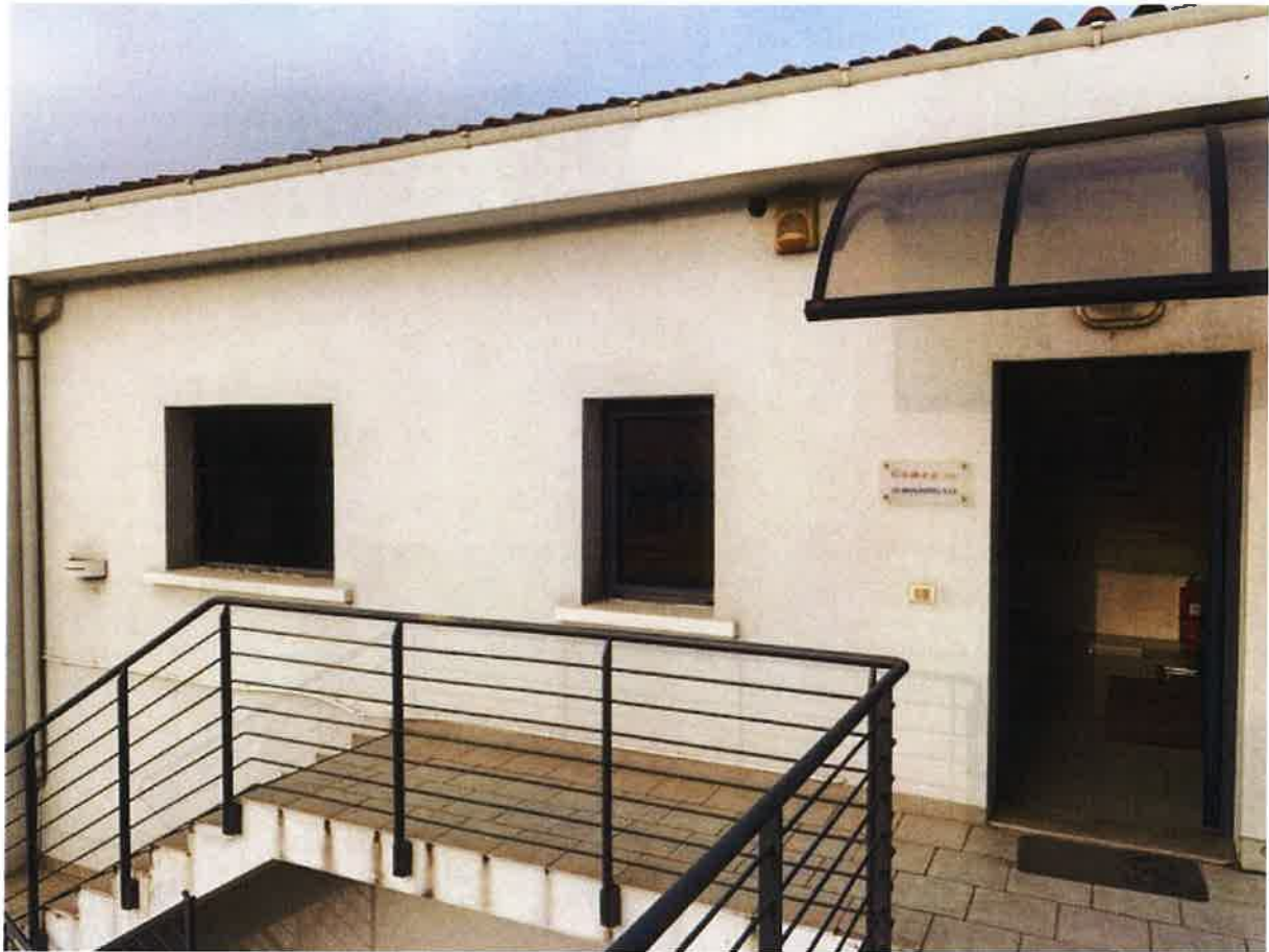
VISTA ESTERNA LOTTO 2