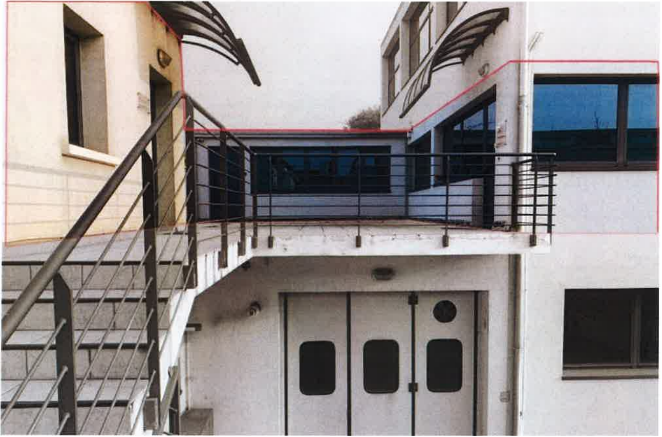
VISTA ESTERNA LOTTI 1 E 2