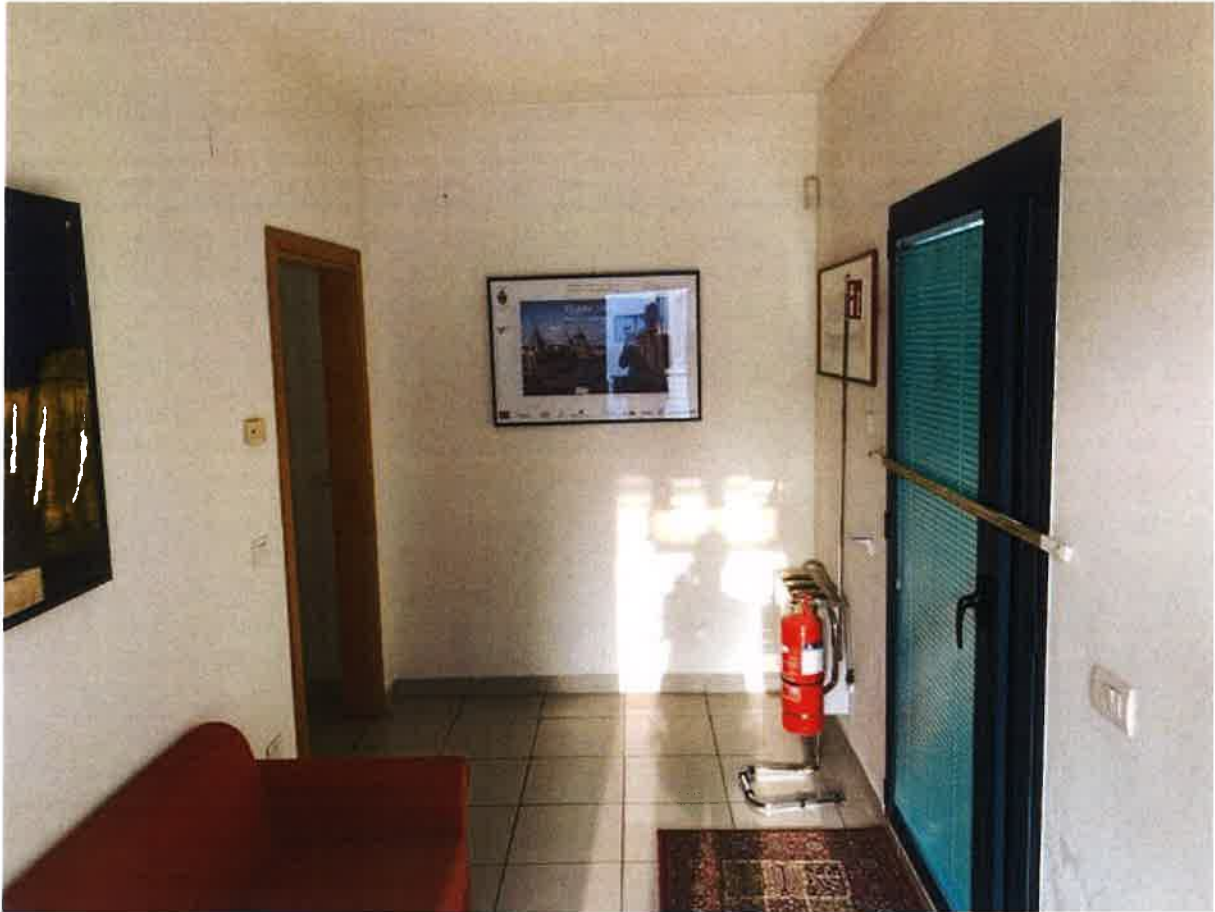
VISTA INTERNA LOTTO 2